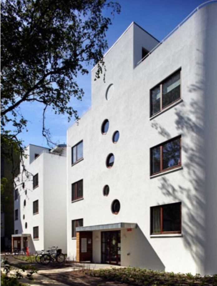
Entreen er centreret i bygningen, og de runde vinduer er i en god størrelse, så lyset kan komme ind. Vinduerne kan lukkes helt op.

vejen, og i den fælles gårdhave er det ikke fliser og affaldsstativer, der rammer blikket. Det er synet af gamle træer og nyplantede rododendronbede. Med tiden vokser der et tæppe af grønt bunddække op, og bøgehække ud mod vejen skal skærme området af. Fra landskabsarkitektens side har det været tanken at holde fast i det oprindelige haverum. Så mange af de eksisterende træer som muligt er bevaret, og nye store træer er plantet. Den oprindelige vandfontæne er under restaurering og bliver genetableret. Man får indtryk af et åbent og rummeligt areal, der knytter an til kvarterets omkringliggende villahaver.