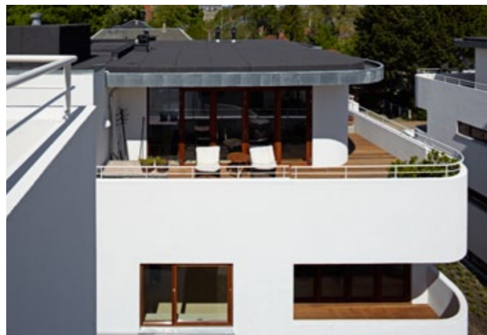
Tagterrasser i den store skala, der følger bygningen rundt om et hjørne.

► med beboerne herude og med Københavns Kommune.