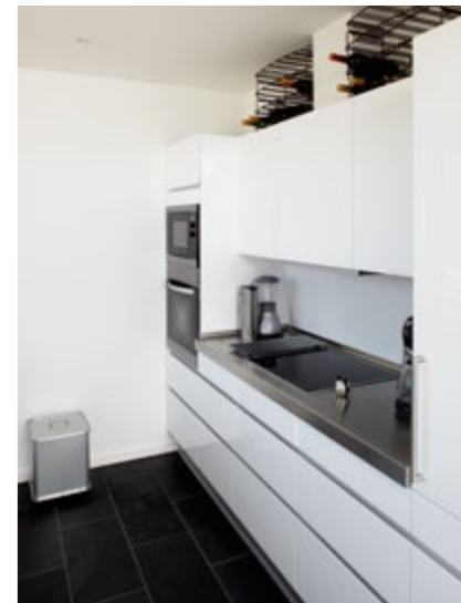
Svane har leveret køkkenløsningen, hvor der har været en del tilvalgsmuligheder – det gælder også den omfattende Miele-løsning med bl.a. kogeplader i glaskeramik eller induktion.

Forarbejdet fra bygherres og fra White arkitekters side viste sig at være en kompleks proces med mange aktører, holdninger og lovmæssige forhold at tage hensyn til. Projektet resulterede bl.a. i en ny lokalplan for området, og arkitekter og bygherre indgik i et langvarigt og tæt samarbejde med Københavns Kommune og beboerne i området. I en længere periode var der møde på tegnestuen hver tirsdag med beboerforeningerne og repræsentanter fra planafdelingen i Københavns Kommune til langt ud på aftenen. Også medie-