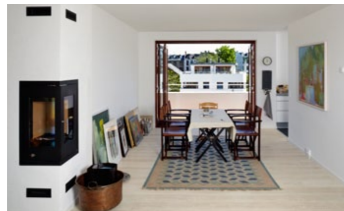
Hjørnepejs fra Living Flames og mulighed for at trække naturen ind i stuen ved at åbne foldedøren til altanen helt op.

tilbage til Arne Jacobsens Bellavista-lejligheder fra 1934. Murene i beton har fået et kraftigt isoleringslag med StoTherm Minerals fra Sto Danmark A/S – et isolerende facadesystem, der er modstandsdygtigt over for mekanisk og hydrotermisk belastning. Løsningen giver en diffusionsåben overflade, der leder damp og fugt